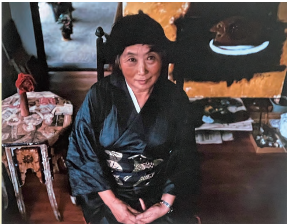
「三岸 節子」